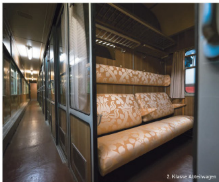
2. Klasse Abteilwagen

Sämtliche Wagen sind mit Kurbel Fenstern, Druckbelüftung und einer Heizung ausgestattet.