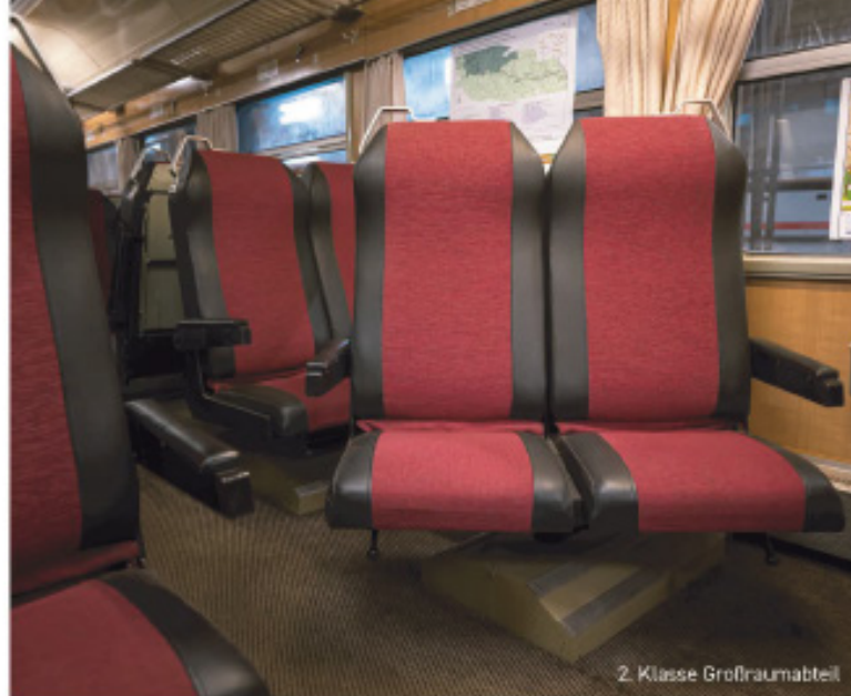
2. Klasse Großraumabteil