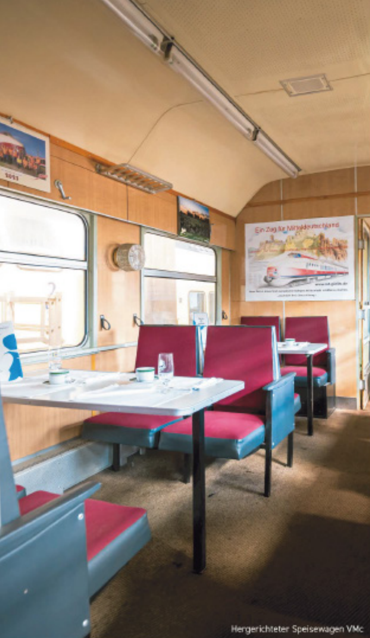
Hengerichteter Speisewagen VMc

Um das Reiseerlebnis für die Fahrgäste abzurunden, gibt es im Speisewagen 23 Plätze, wo sowohl große als auch kleine Speisen serviert werden können. Gerne bewirten wir die Reisenden aus unserer gut ausgestatteten Küche. Die sanitären Einrichtungen wurden auf den Stand der Technik gebracht, ohne ihren zeitlichen Charme zu verlieren.