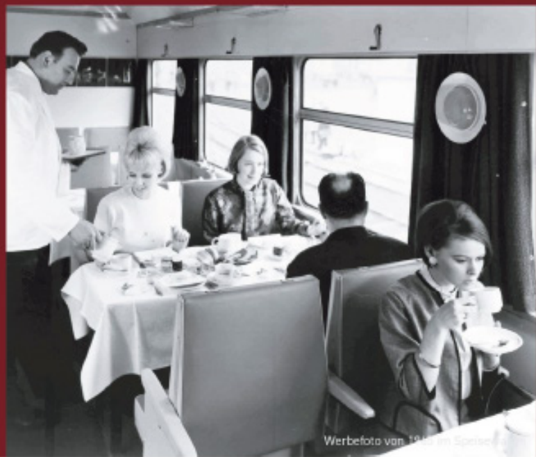
Werbefoto von 1965 im Speisewagen

Nach dem Ende des internationalen Verkehrs fuhren einige Züge noch auf der Strecke Berlin - Bautzen oder wurden im Sonderverkehr eingesetzt. 2003 erfolgte die Abstellung der letzten betriebsfähigen Einheit des SVT Görlitz.