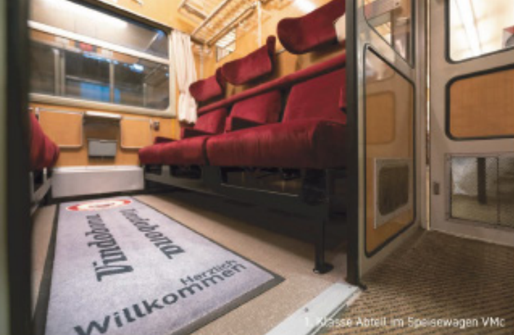
1. Klasse Abteil im Speisewagen VMc