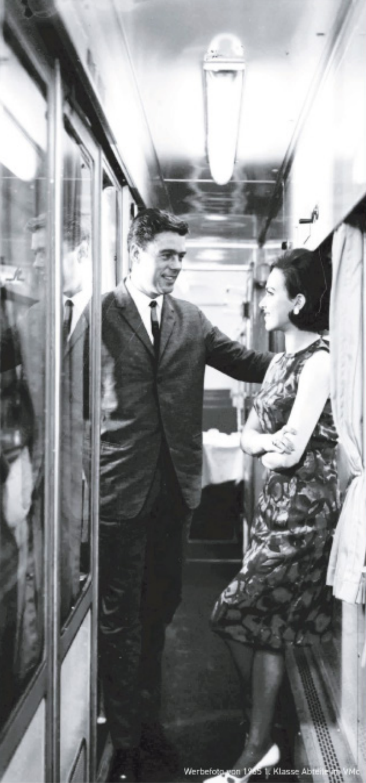
Werbefoto von 1965 1. Klasse Abteil im VMC